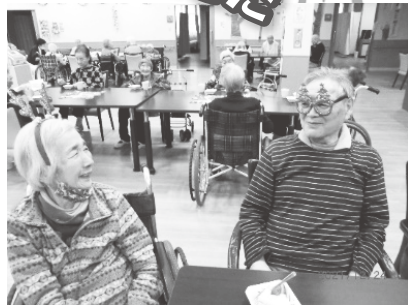
メリークリスマス