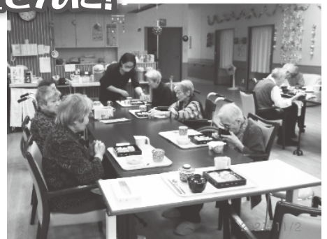
職人さんが握ったお寿司は最高!