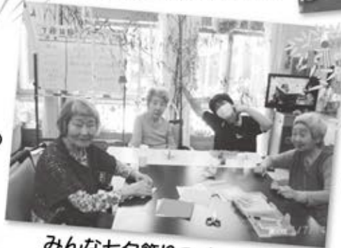
みんな七夕飾りつくったよ