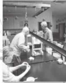
流しそうめん 早く流れてこないかな