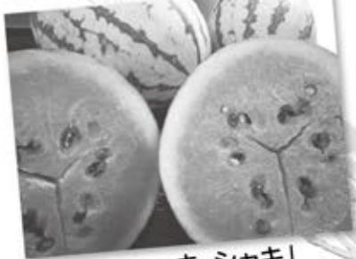
「甘くてシャッキ・シャキ」 上出来でしたよ!!