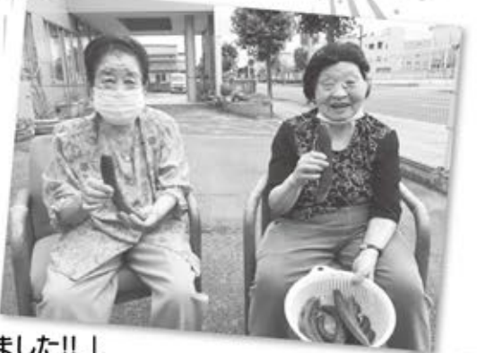
「きゅうりは豊作で100本以上とれました!!」