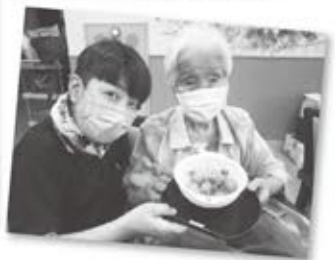
利用者さんと収穫し、一緒に調理して食べました。